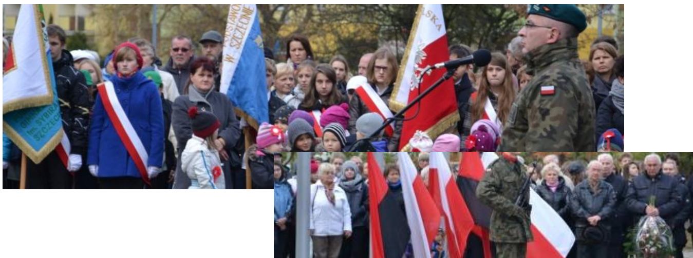
Samorząd Szkolny wraz z gronem pedagogicznym pod pomnikiem Niepodległości