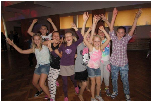
Dziewczynki z 4a bawiły się w grupie