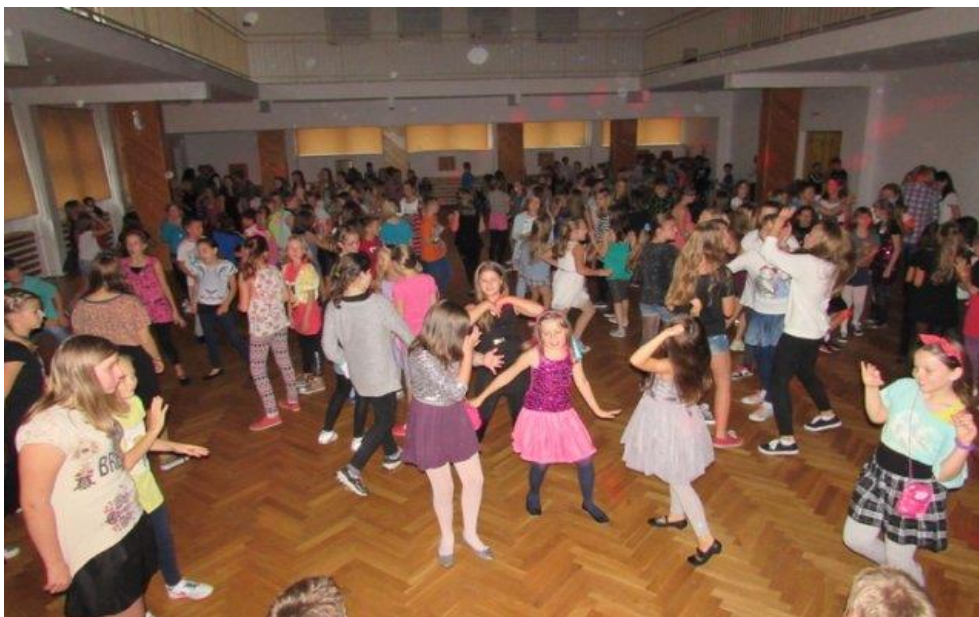
Na dyskotece tłumy... dziewcząt. One nigdy nie zawodzą!