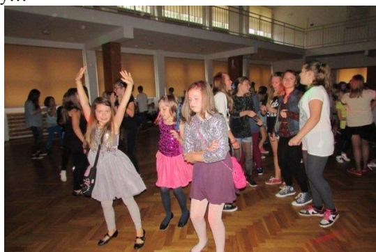
Układy taneczne były popularne, ale nie zabrakło indywidualności...