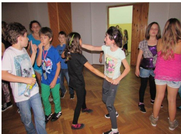
Ciekawe, co obiecali trzymać w tajemnicy chłopcy...