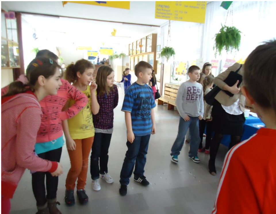
Uczniowie rzucający pomidorami do celu.